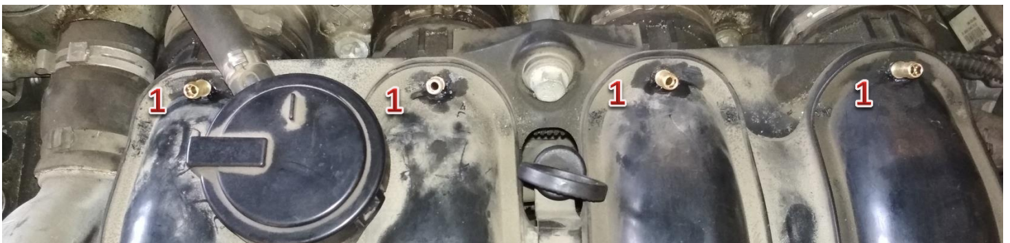
1-dysze wtryskiwaczy gazu/gas injector nozzles