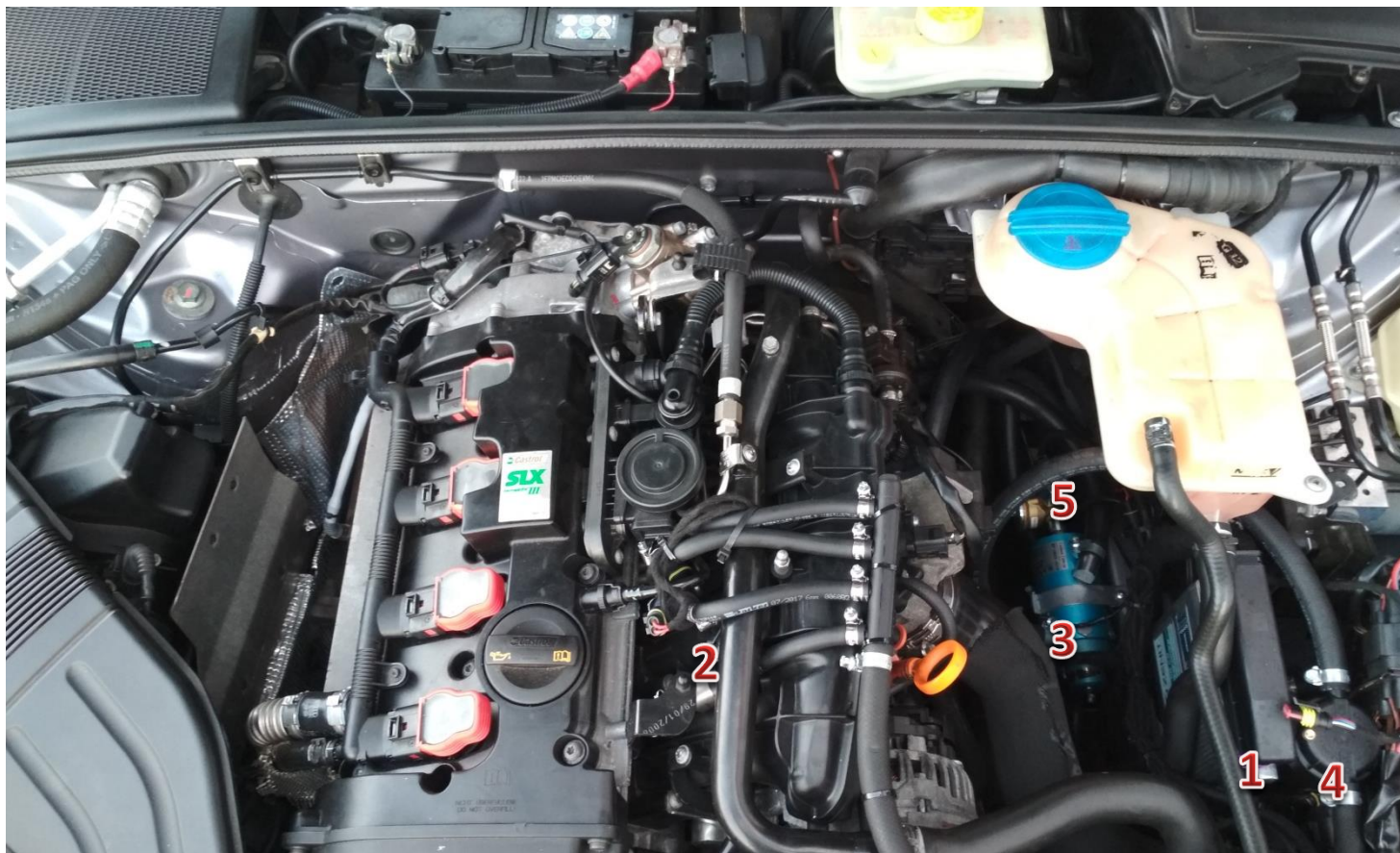
1-sterownik/ECU Zenit Direct, 2-wtryskiwacze gazu/gas injectors, 3-reduktor/reducer, 4-filtr fazy lotnej/gas phase filter, 5-elektrozawór z filtrem fazy ciekłej/electrovalve with liquid gas phase filter