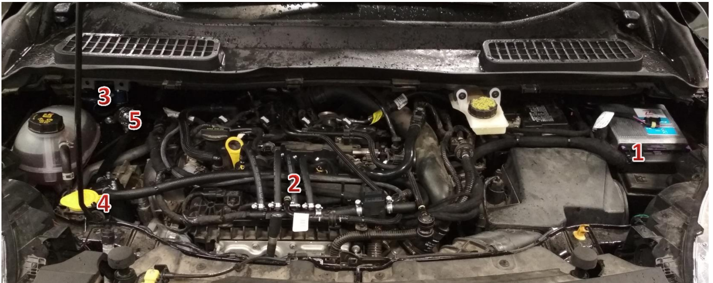
1-sterownik/ECU Zenit Direct, 2-wtryskiwacze gazu/gas injectors, 3-reduktor/reducer, 4-filtr fazy lotnej/gas phase filter, 5-elektrozawór z filtrem fazy ciekłej/electrovalve with liquid gas phase filter