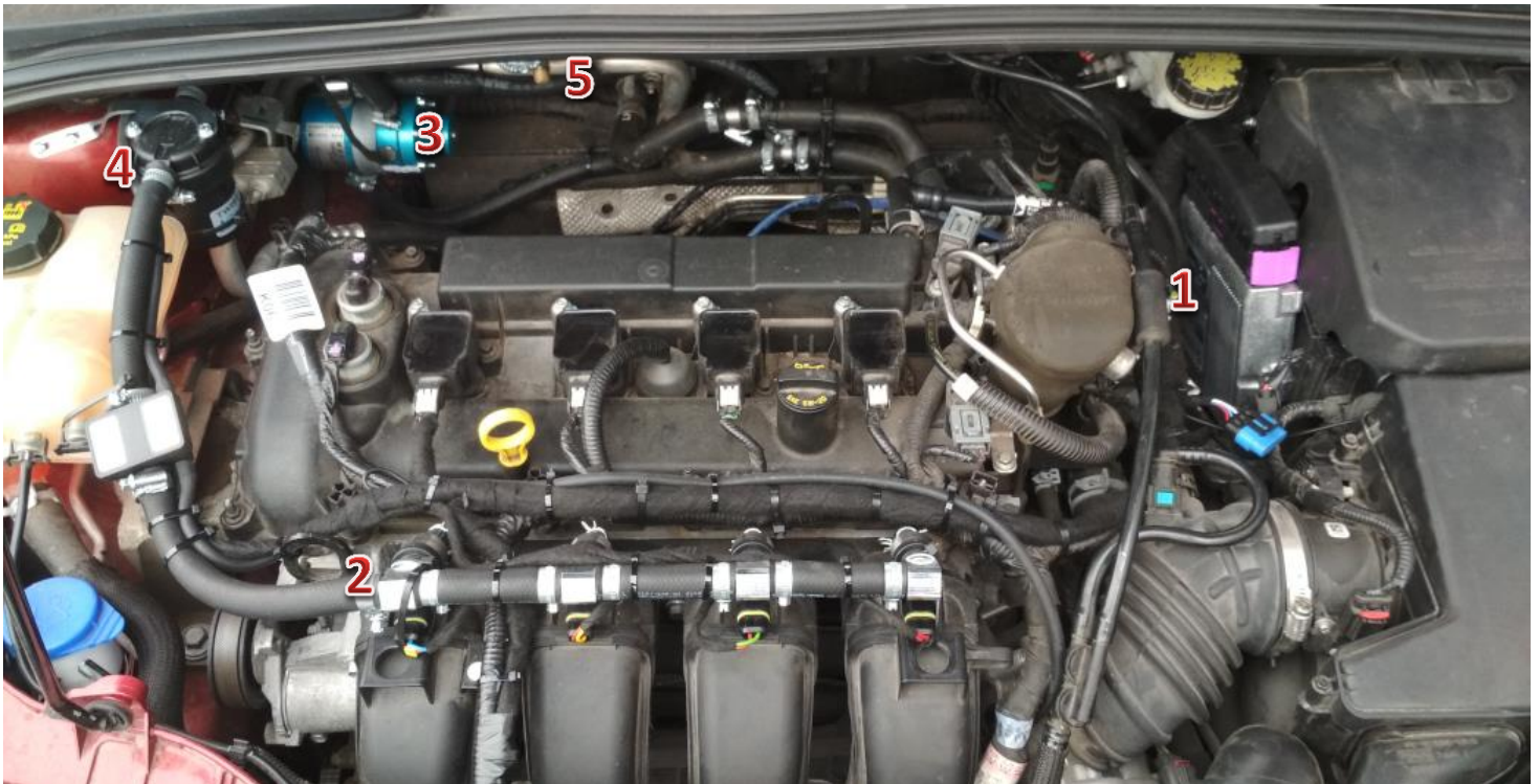
1-sterownik/ECU Zenit Direct, 2-wtryskiwacze gazu/gas injectors, 3-reduktor/reducer, 4-filtr fazy lotnej/gas phase filter, 5-elektrozawór z filtrem fazy ciekłej/electrovalve with liquid gas phase filter