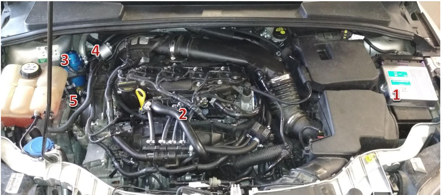
1-sterownik/ECU Zenit Direct, 2-wtryskiwacze gazu/gas injectors, 3-reduktor/reducer, 4-filtr fazy lotnej/gas phase filter, 5-elektrozawór z filtrem fazy ciekłej/electrovalve with liquid gas phase filter