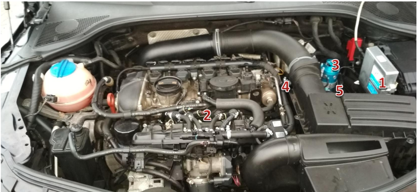
1-sterownik/ECU Zenit Direct, 2-wtryskiwacze gazu/gas injectors, 3-reduktor/reducer, 4-filtr fazy lotnej/gas phase filter, 5-elektrozawór z filtrem fazy ciekłej/electrovalve with liquid gas phase filter