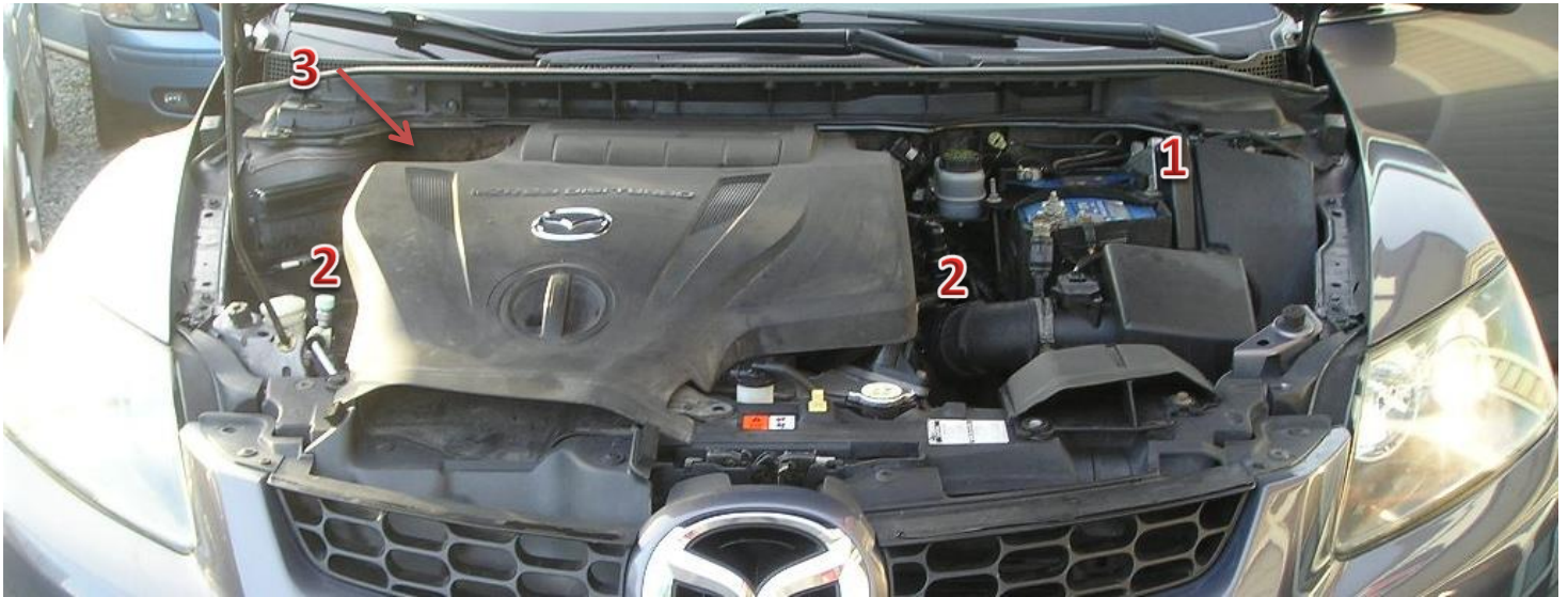
1-sterownik/ECU Zenit Direct, 2-wtryskiwacze gazu/gas injectors, 3-reduktor/reducer, elektrozwór z filtrem fazy ciekłej/electrovalve with liquid gas phase filter