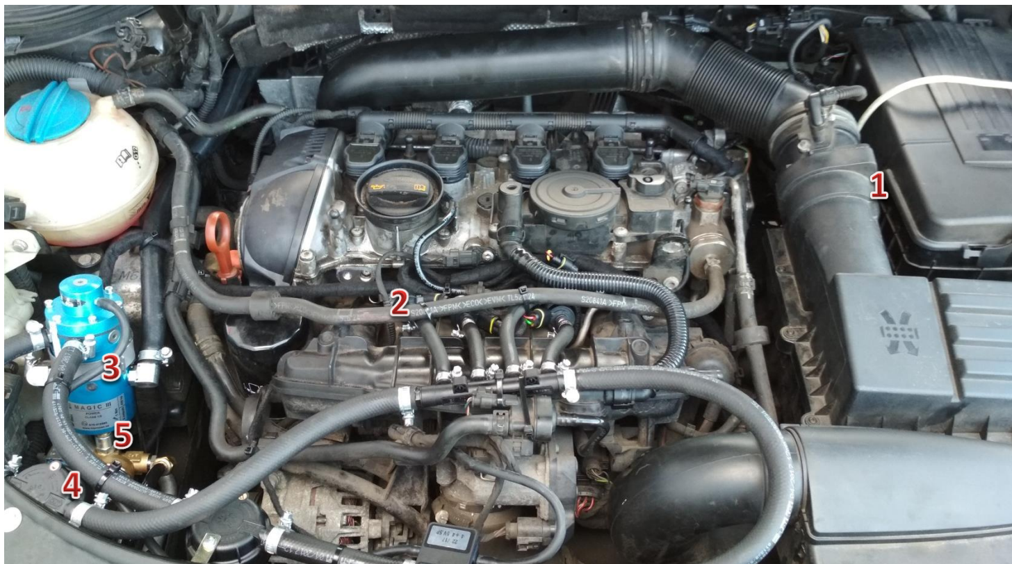
1-sterownik/ECU Zenit Direct, 2-wtryskiwacze gazu/gas injectors, 3-reduktor/reducer, 4-filtr fazy lotnej/gas phase filter, 5-elektrozawór z filtrem fazy ciekłej/electrovalve with liquid gas phase filter