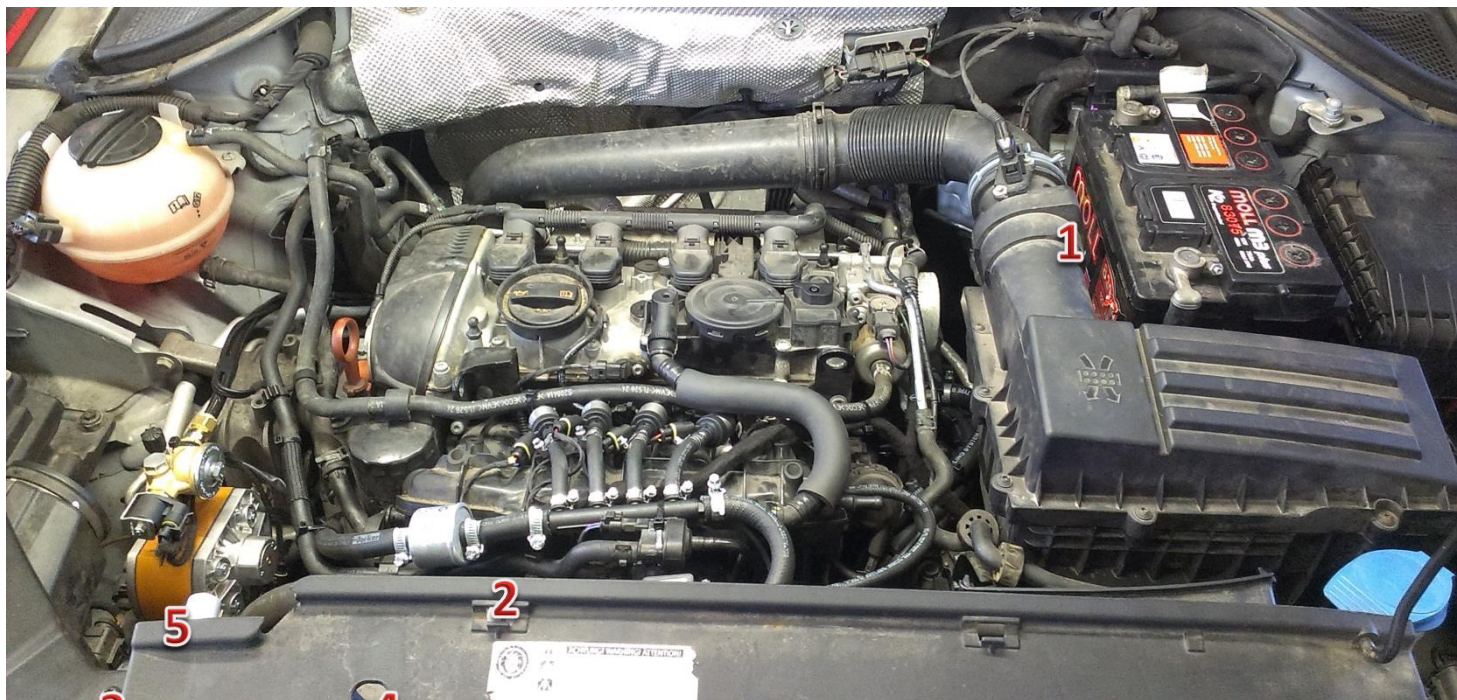
1-sterownik/ECU Zenit Direct, 2-wtryskiwacze gazu/gas injectors, 3-reduktor/reducer, 4-filtr fazy lotnej/gas phase filter, 5-elektrozawór z filtrem fazy ciekłej/electrovalve with liquid gas phase filter