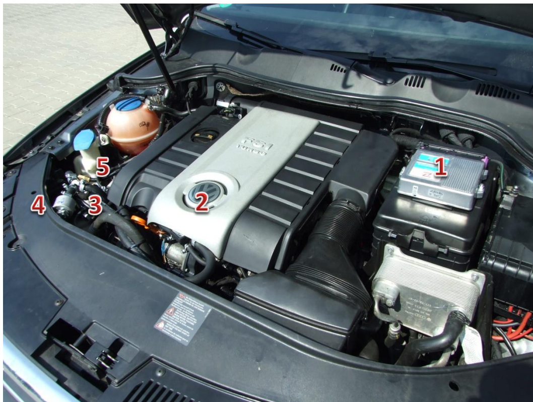
1-sterownik/ECU Zenit Direct, 2-wtryskiwacze gazu/gas injectors, 3-reduktor/reducer, 4-filtr fazy lotnej/gas phase filter, 5-elektrozawór z filtrem fazy ciekłej/electrovalve with liquid gas phase filter