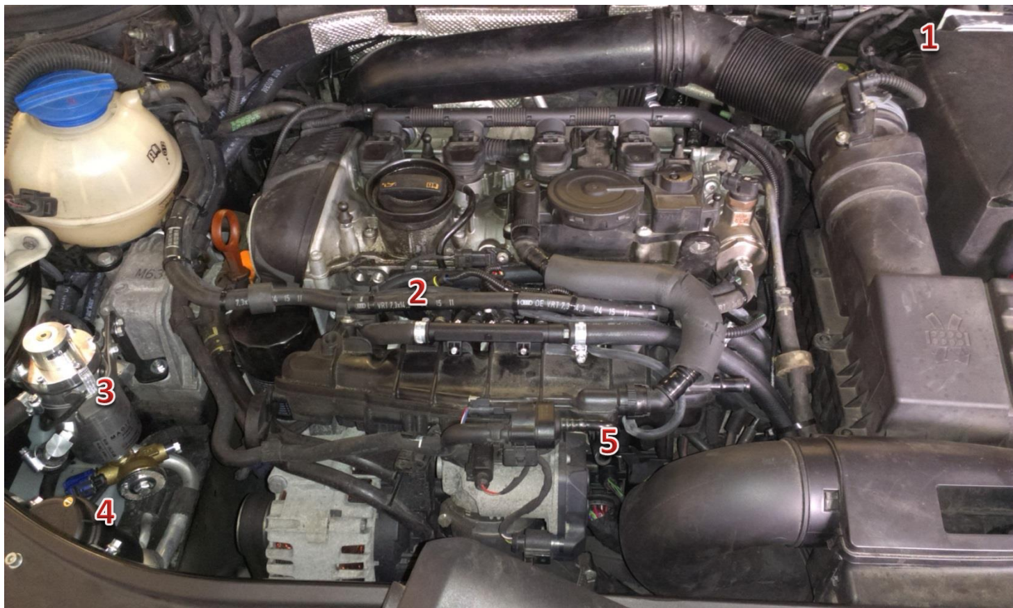
1-sterownik/ECU Zenit Direct, 2-wtryskiwacze gazu/gas injectors, 3-reduktor/reducer, elektrozwór z filtrem fazy ciekłej/electrovalve with liquid gas phase filter, 4-filtr fazy lotnej/gas phase filter, 5- króciec podciśnienia/vacuum nozzle